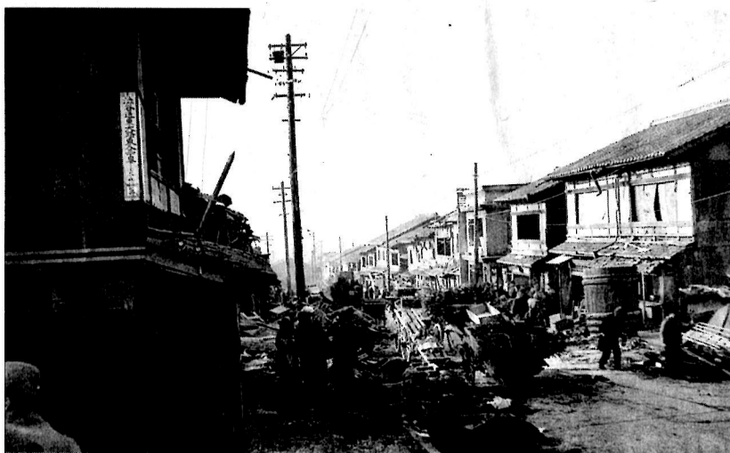
●作製した馬町空襲の写真付き地図を説明する京都女子大の学生ら ●馬町空襲直後の渋谷通上馬町付近の写真